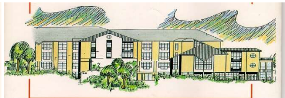
Caritashaus St. Elisabeth

Arenberger Caritasvereinigung e.V. Pfarrer-Kraus-Straße 150, 56077 Koblenz